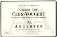
CLOS VOUGEOT 2004 GRAND CRU

Rouge Carmin, une robe somptueuse. Des arômes assez classiques : cuir, fourrure, sous-bois, appelant le gibier mariné, le civet ou le fromage de caractère. La violette, également classique, point en rétro-olfaction. Tout en finesse, en élégance, avec un boisé bien fondu, ce vin s'annonce comme une belle réussite.