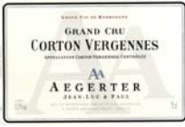
CORTON VERGENNES 2005 GRAND CRU 17/20

Assez complet, saveur racée, un peu pointue d'épices, boisé remarquablement calculé.