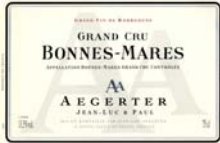
BONNES-MARES 2004* GRAND CRU

Rouge Carmin, une robe somptueuse. Des arômes assez classiques : cuir, fourrure, sous-bois, appelant le gibier mariné, le civet ou le fromage de caractère. La violette, également classique, point en rétro-olfaction. Tout en finesse, en élégance, avec un boisé bien fondu, ce vin s'annonce comme une belle réussite.