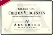
CORTON VERGENNES 2005** GRAND CRU

Rubis dense, un vin d'une folle maturité, maîtrisée cependant. Le bouquet intense livre des notes de fruits confiturés, de cacao et de tabac blond, avec du cuir et du bois brûlé en fond. Suave, le palais montre des tanins présents mais fondus et finit sur les épices. Un ensemble jeune et prometteur.