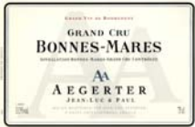
BONNES-MARES 2004 GRAND CRU 17/20

Assez complet, saveur racée, un peu pointue d'épices, boisé remarquablement calculé.