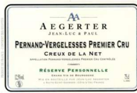
PERNAND-VERGELESSES PREMIER CRU CREUX DE LA NET 2008 16/20

Assez gras, joli fruité d'agrumes et de mile, pas de lourdeur, boisé bien intégré, du charme immédiat.