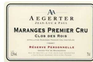
MARANGES PREMIER CRU CLOS DES ROIS 2008 15/20

Joli nez, élégant, de fleur de vigne, délicieux, raffiné, long, rappelant la classe de ces terroirs en blanc.