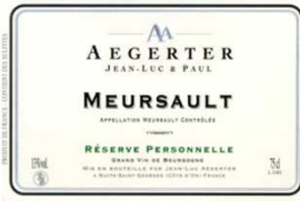
MEURSAULT 2008 16,5/20

Robe foncée, boisé marqué, corps souple mais tanin astringent, vin de garde, manquant peut-être un peu de nuances dans le fruit.