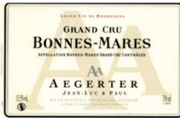
BONNES-MARES GRAND CRU 2008 17/20

Robe dense, boisé marqué, tension évidente, tanin ferme, terroir bien mis en valeur, de la classe et du potentiel.