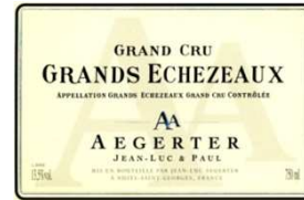
GRANDS -ECHEZEUX GRAND CRU 2008 16/20

Robe dense, boisé marqué, tension évidente, tanin ferme, terroir bien mis en valeur, de la classe et du potentiel.