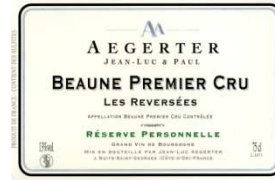
BEAUNE PREMIER CRU LES REVERSEES 2009