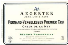
PERNAND-VERGELESSE PREMIER CRU CREUX DE LA NET 2009

Très ample et généreux, avec une remarquable finesse de texture, c'est un Meursault archétypique, à la finale subtile et parfumée.