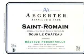
SAINT-ROMAIN SOUS LE CHÂTEAU 2009

Beau caractère svelte et profond, grande allonge nerveuse. De la personnalité et du potentiel.