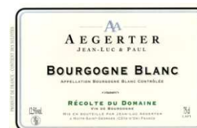
BOURGOGNE BLANC 2009 Récolte du Domaine

Joli bourgogne parfumé et souple, idéal pour la bonne restauration.