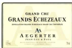
GRANDS ECHEZEUX GRAND CRU 2009

Encore très juvénile, un vin de beau potentiel, charnu, dense et intense. Belle sève.