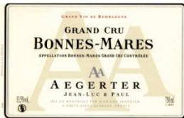
BONNES-MARES GRAND CRU 2009